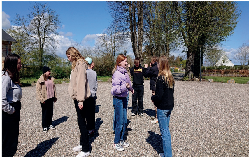
Samtale er kittet i et fællesskab; også samtale kan man øve sig i – to og to eller to og tre.

Inden Corona satte en stopper for at mødes fysisk, var der ikonværksted for konfirmander. Ikonerne har stået og ventet og ventet på at blive gjort færdige. Det lykkedes at nå i mål med størstedelen af dem denne lørdag i maj. Tilsammen udgør de nu en lille mobil altertavle. Heldigvis var det vindstille ude på Storebæltsskysten, så den blev stående på sine pinde.